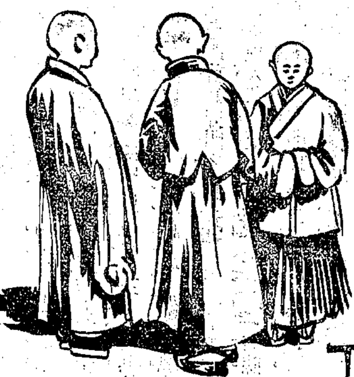
發起人 開先 向畏之 諸儒夫同啓